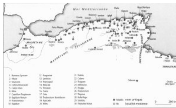
Fig. 3 : Carte de l'Afrique romaine. Publiée dans Antonio Ibbá, Giusto Traiana, L'Afrique romaine : de l'Atlantique à la Tripolitaine, 69-439 ap. J.-C. , Bréal, Rosny-sous-Bois, 2006, p. 35.

l'Atlantique, la Méditerranée et les golfes des Syrtes ont permis aux cités maures, numides et phénico-puniques de s'épanouir et de s'inscrire dans les routes commerciales méditerranéennes.