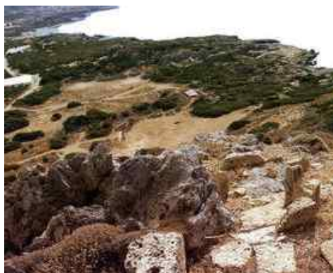
Fig. 7. General view of the harbour's basins from the acropolis (Hadjidaki-Stefanakis 2004, σ. 110)