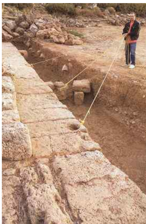
Fig. 5. Part of quay with binding holes and mooring stones (Hadjidaki-Stefanakis 2004, σ. 115)