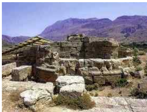
Fig. 3. Defensive circular tower of the harbour ( http://www.ypai.gr/atlas/thesi.asp?idthesis=491 )