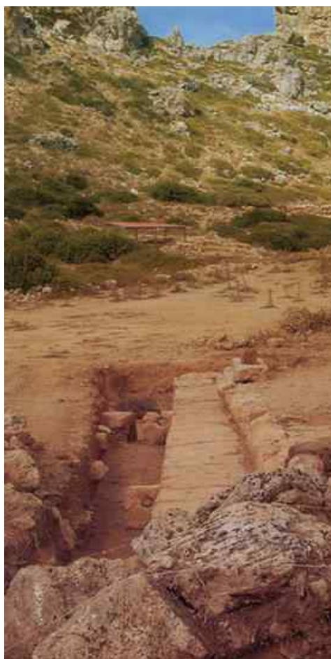
Fig. 6. Quay with mooring stones (Chadjidaki - Stefanakis 2004, p.118)