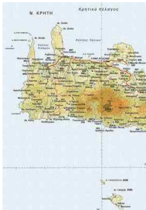
Fig. 1. Map of west Crete showing Phalasarna ( http://www.ypai.gr/atlas/thesi.asp?idthesis=491 )