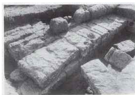
Fig. 4. Part of quay under excavation. A binding hole is visible on an ashlar, as well as a mooring stone at the far end on the section of the excavation trench (Chadjidaki 1993, Pl. 169)