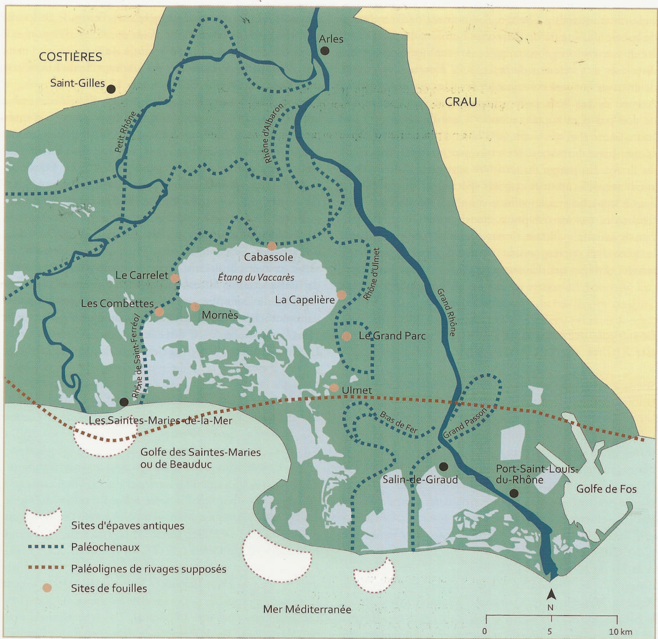
Sites archéologiques identifiés et récemment explorés dans l'île de Camargue.