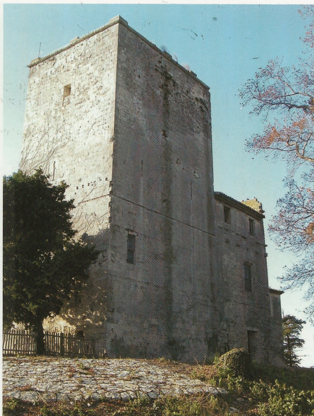
Tour médiévale de La Motte, à Saint-Gilles, sur la rive droite du Petit Rhône, face à Albaron.