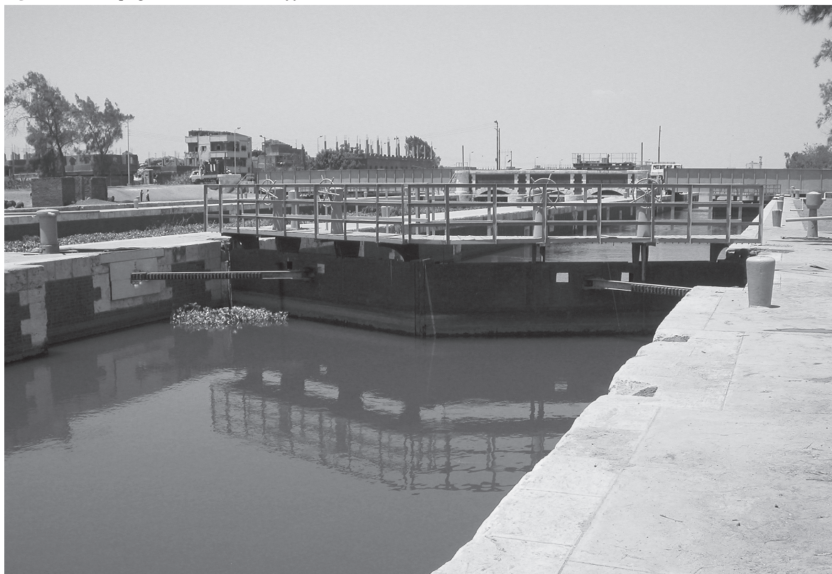
Fig. 3. Écluse d'Abū Ḥummuṣ, à une quarantaine de kilomètres d'Alexandrie.