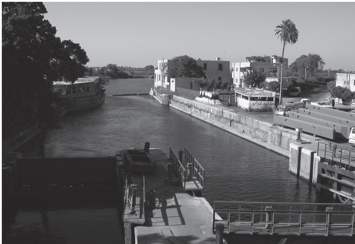
Fig. 2. Point de captage sur le Nil à Mahmūdiyya (Al-ʿAṭf), vis-à-vis de Fuwwa.