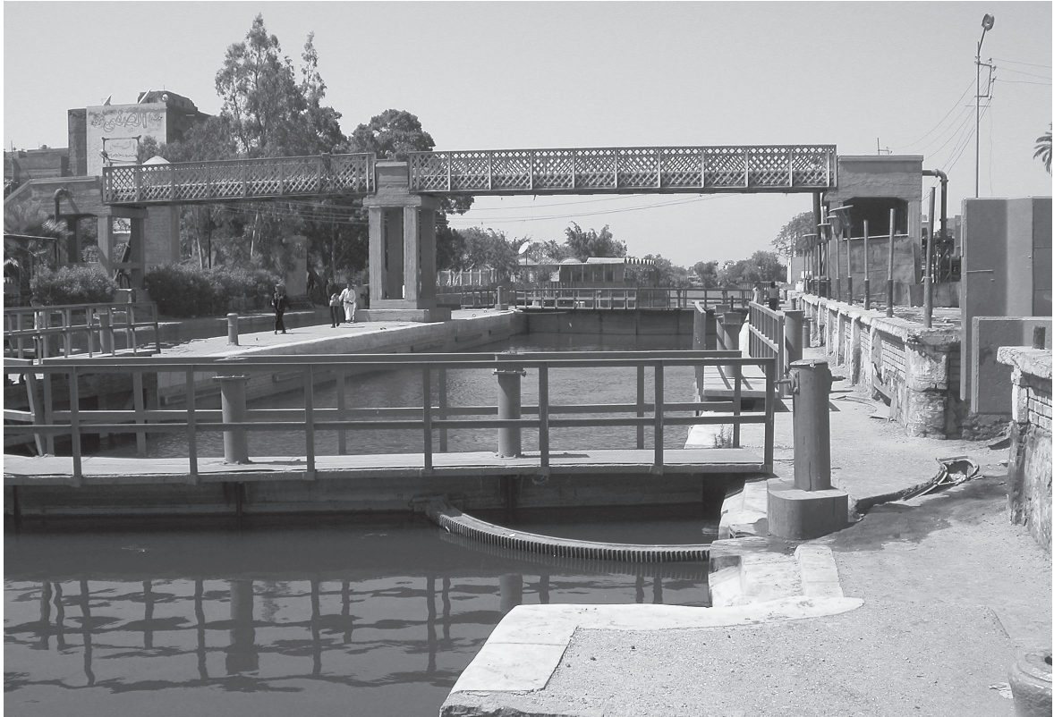
Fig. 4. Écluse dans le village de Maḥmūdiyya (Al-'Aṭf).