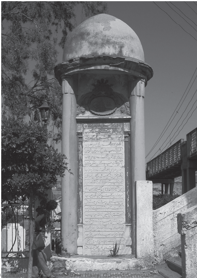
Fig. 5. Inscription d'Al-'Aṭf commémorant les travaux de restauration du canal d'Alexandrie par le vice-roi Muhammad Ali, en l'honneur de son suzerain le sultan Maḥmūd. Poème chronogramme du poète turc 'Izzet Molla.