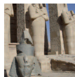
Archéologie à l'international

Sa totale indépendance fait de GINGER CEPTP ARCHEO un partenaire privilégié, intermédiaire idéal entre les maîtres d'ouvrage ou aménageurs et les autorités scientifiques (DRAC-SRA) pour la réalisation des opérations et études archéologiques et historiques.