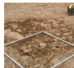
Relevé des structures