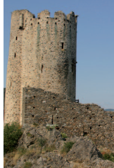
Archéologie du bâti

Prélever Analyser Diagnostiquer Recommander