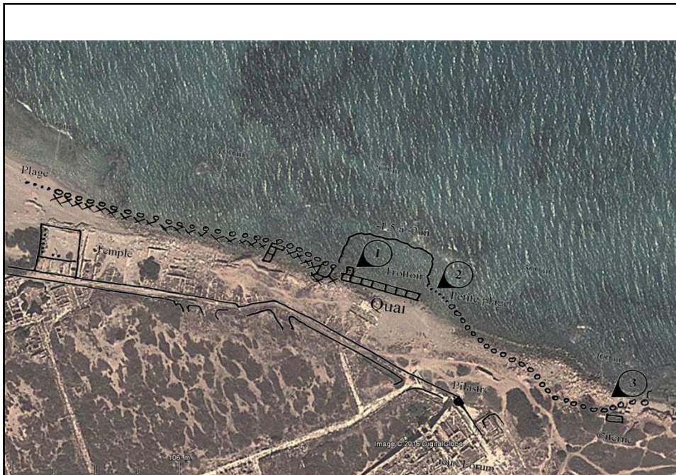
Leptis Magna, côte NW avec quai et anneau d'amarrage.

Les repères sont le temple, la route et le pylastre. Le trottoir est visible aussi car pas de houle d'Est sur le faible fond.